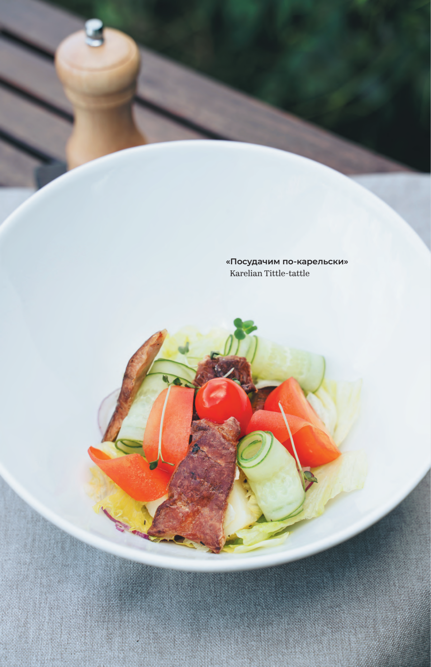
«Посудачим по-карельски» Karelian Tittle-tattle