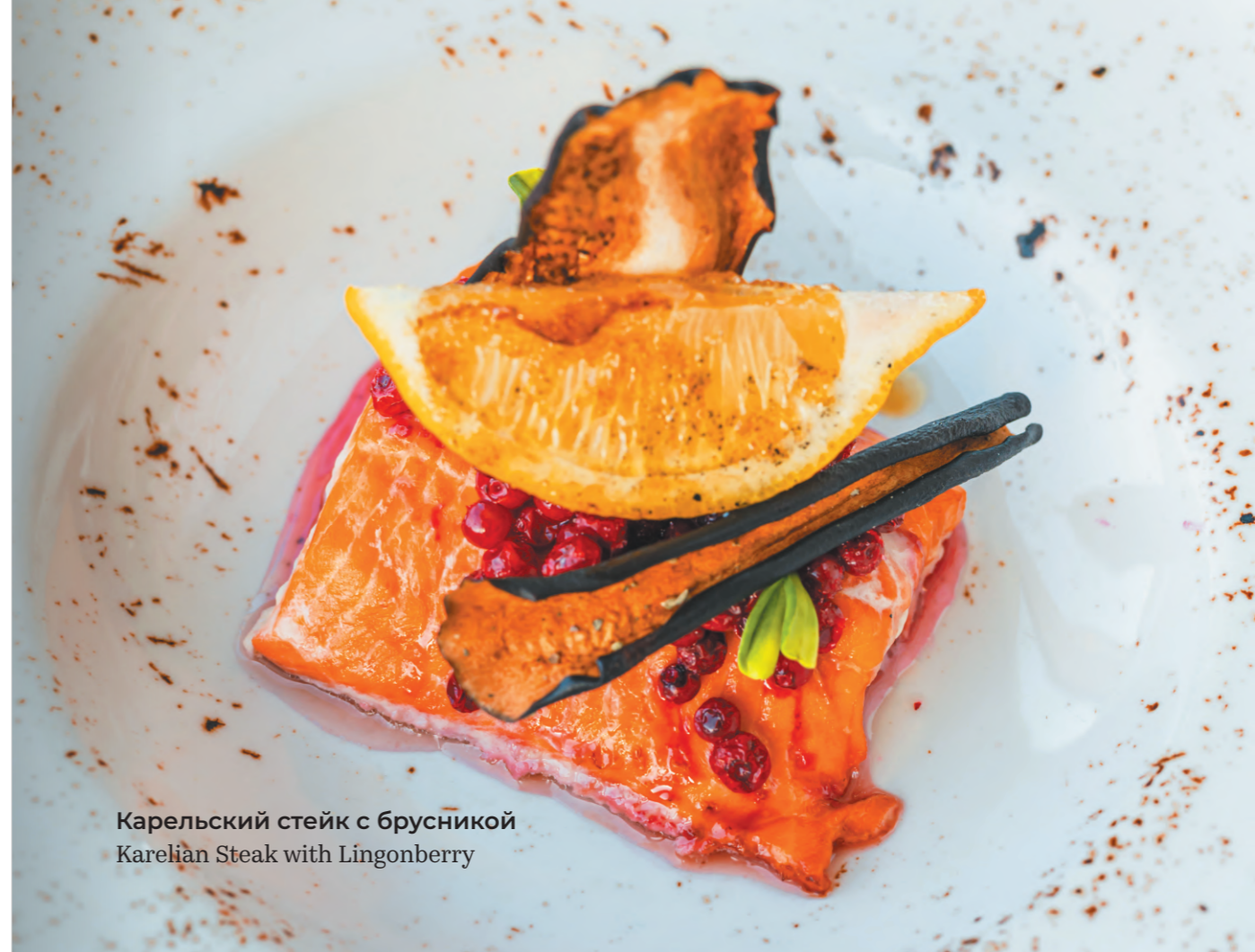
Карельский стейк с брусникой Karelian Steak with Lingonberry

Juicy Karelian steak made from Karelian trout with a berry-caramel crust.