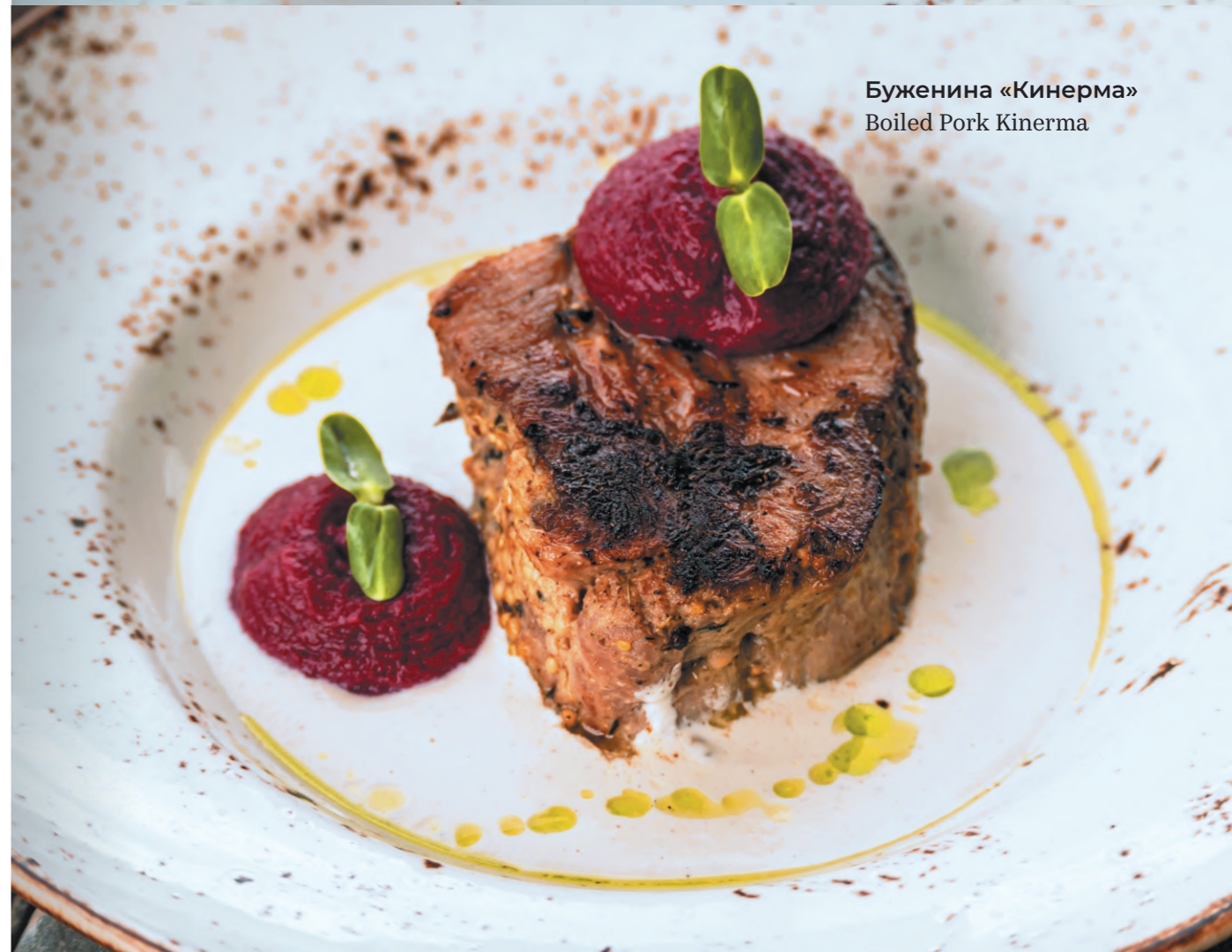
Буженина «Кинерма» Boiled Pork Kinerma