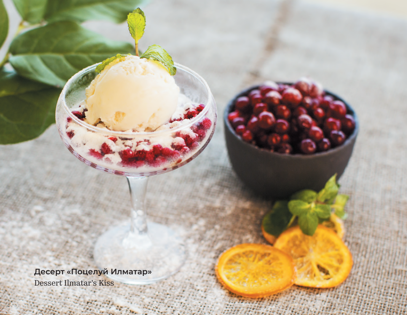
Десерт «Поцелуй Илматар» Dessert Ilmatar's Kiss