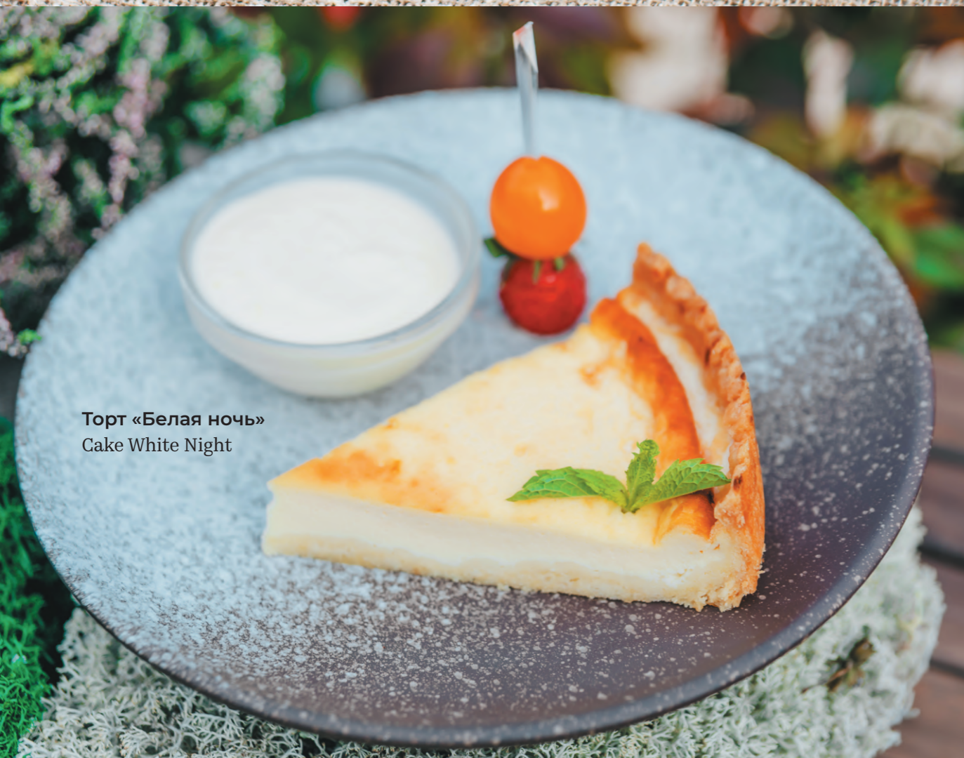
Торт «Белая ночь» Cake White Night